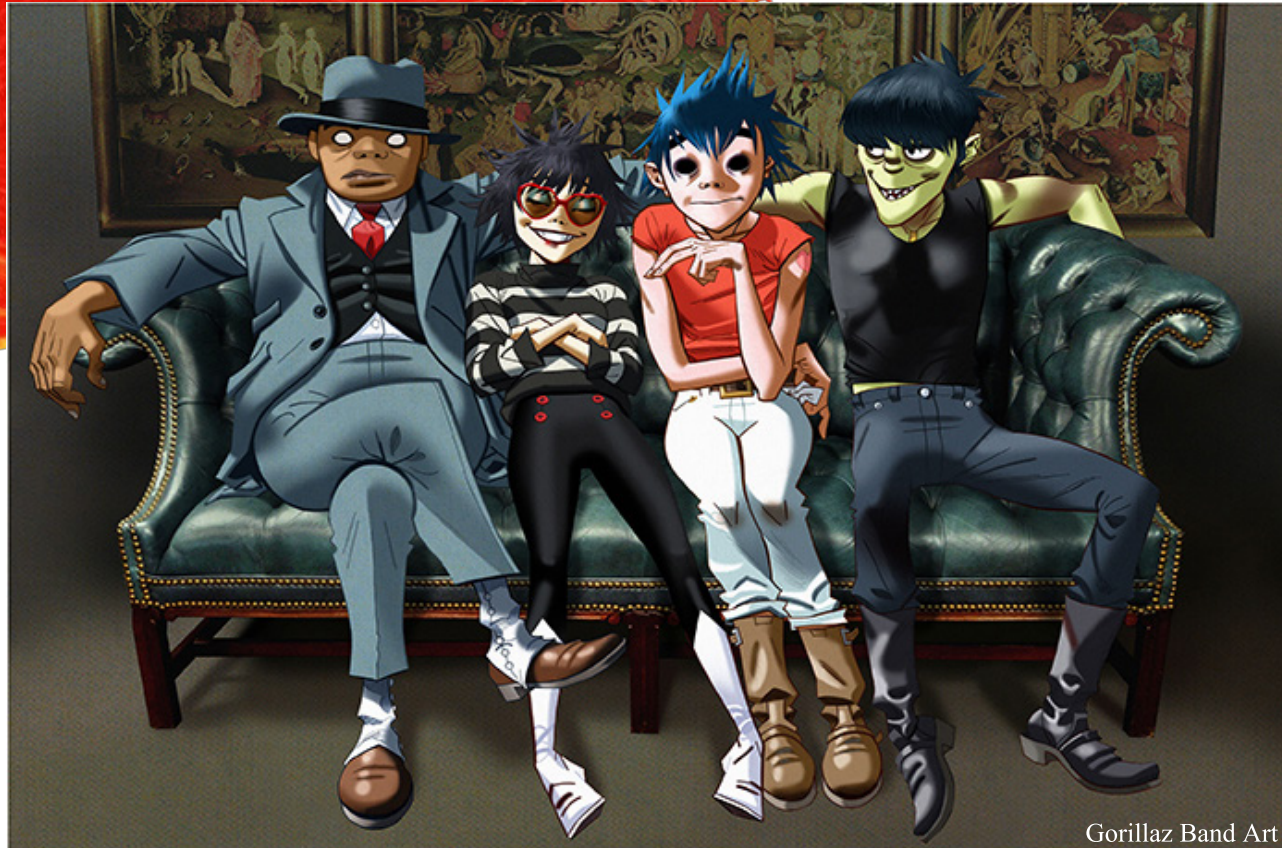
Gorillaz Band Art

"I'LL SAY TO YOUNG ARTIST TO ALWAYS DRAW, DESIGN OR CREATE FROM THE THINGS THAT EXCITE YOU, NOT WHAT YOU THINK SHOULD BE INSPIRING YOU."